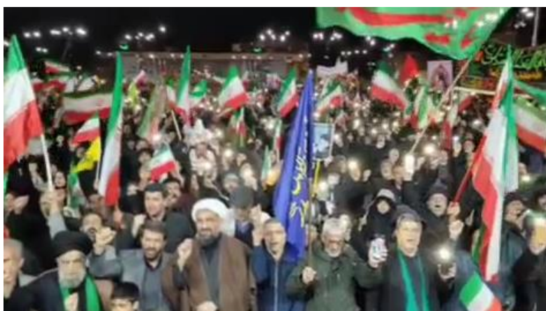
○ اسفراین : شب سی و یکم گردهمایی خیابانی