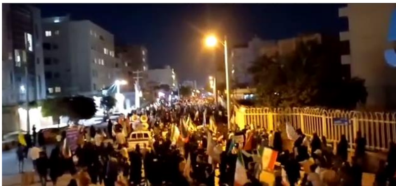
○ یاسوج : همخوانی سرود ملی جمهوری اسلامی در شب ۱۲ فروردین